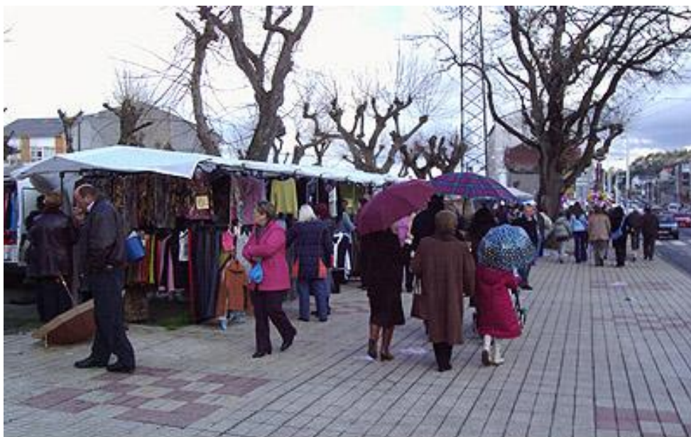
Avenida de Bergantiños. Un día de feira en Peisaco

¿Cantos azulexos co dígito 9 precisan, en total, para formar eses cen números?