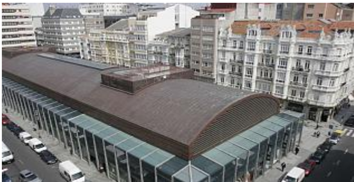
Praza de Lugo (A Coruña)

Na parte do plano da Coruña, que se vos facilita, hai cinco prazas bastante próximas. A distancia real entre os puntos A e B da Praza de Lugo é de 60 m. Se medides esa distancia no plano, permitiravos facer, cunha aceptable aproximación, os cálculos que se precisan para responder ás seguintes cuestións: